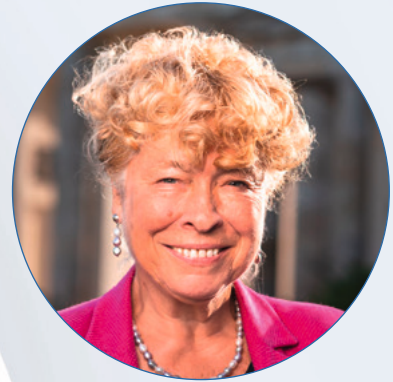
Professorin Dr. Gesine Schwan

Präsidentin, Berlin Governance Platform gGmbH